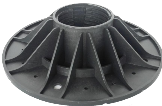
základna A2 – průměr 230 mm plocha základny 415 cm 2