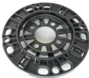
hlava N pohled zespodu