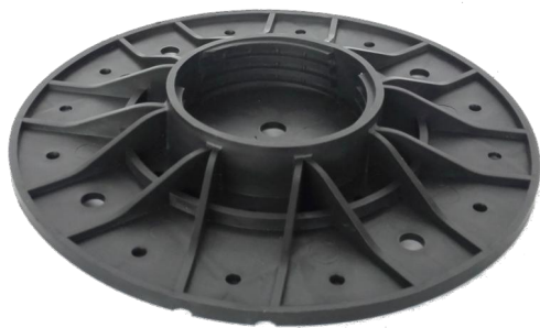
základna A1 – průměr 200 mm plocha základny 314 cm 2