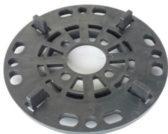
hlava N pohled shora

Při předpokládaném častějším pohybu osob v době užívání prostoru doporučujeme aplikovat pojistnou matici V . Pojistnou matici lze použít pro šneky B , C a D utažením proti základně.