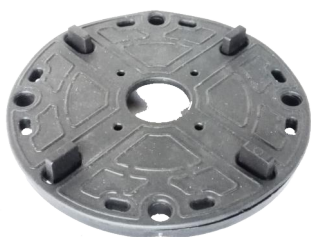
hlava N s nasazenou protihlukovou vložkou 1143-G