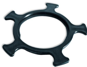
pojistná matice 1123_V