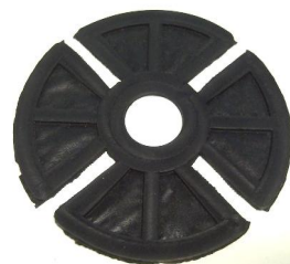
gumová protihluková vložka 1123_S