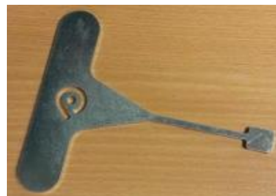
montážní klíč K