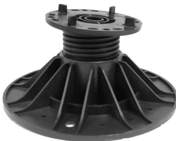
základna A2 (průměr 230 mm) pro výšky nad 70 mm