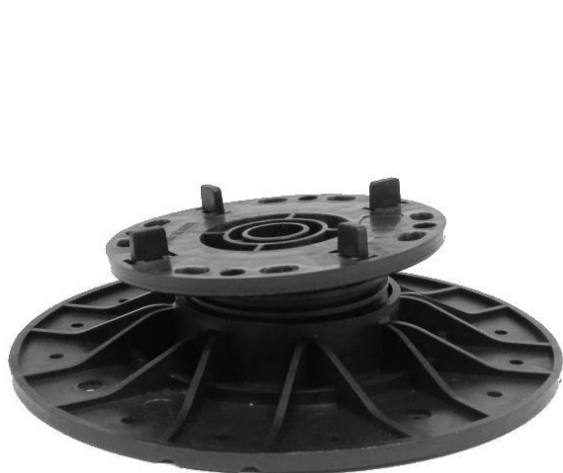
základna A1 (průměr 200 mm) pro výšky do 70 mm