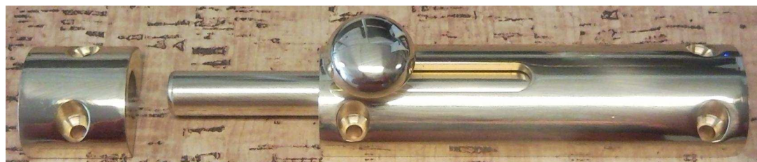
masivní zástrč 072 CT 150 LV

K zástrči 073 si vyberte ze dvou samostatných protikusů.