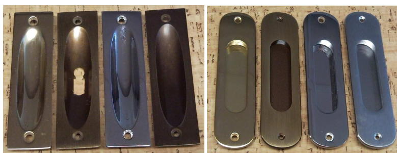
LV BG OC BG LV BG OC CS

Mušle 520 může mít otvor na klíč i na vložku, mušle 523 pouze na klíč.