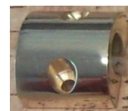
073 IN 00S