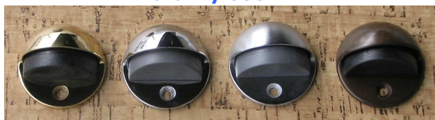
LV OC CS OB