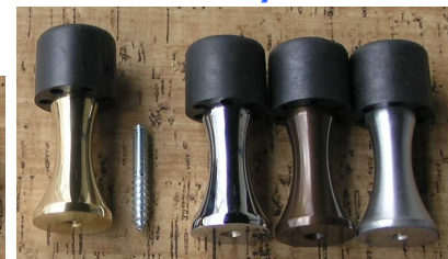
LV OC OB CS