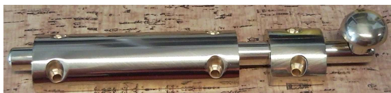
masivní zástrč 073 CT 200 LV