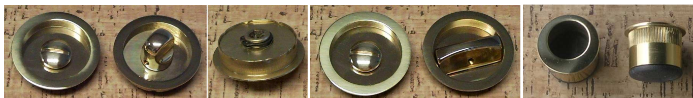
mušle 507 CP LV