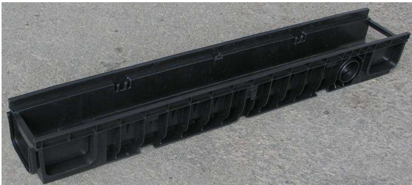
nový žlábek TAURUS PLUS

Řada žlábků TAURUS v provedení z POLYETHYLENU (PE-HD) představuje praktickou a hospodárnou alternativu proti tradičním systémům liniového odvodnění v provedení z betonu a z polymerického betonu. Vzhledem ke svému provedení, umožňují tyto žlábkové systémy jednoduchou dopravu a skladování vzájemným zasouváním do sebe. Kromě toho je materiál, ze kterého jsou tyto žlábkové systémy vyrobeny, zcela recyklovatelný. Žlábek TAURUS je vyroben v souladu s normou UNI EN 1433 , která definuje požadavky na drenážní kanálky pro plochy určené pro chodce a k přejezdu vozidly.