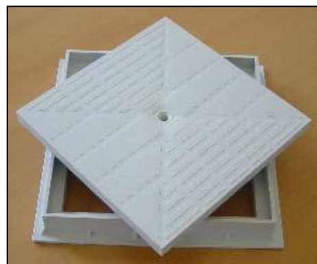
víko 1358 a rámeček 1396