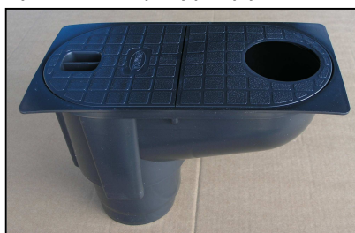
1386N – sifon černý