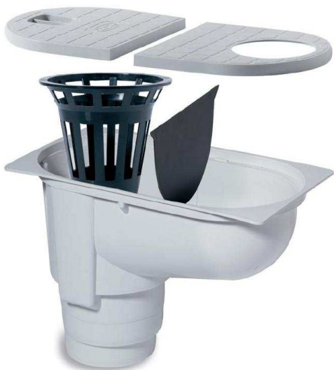
1386G – sifon šedý

Vrchní část sifonu se skládá ze dvou zaoblených dílů. Jeden díl je vstup pro okapovou rouru a druhý díl je víčko. Po uvolnění víčka můžete vyčistit vnitřní prostor sifonu. Uprostřed těla sifonu jsou umístěny po stranách dvě prohlubně, na kterých je volně zavěšena přepážka. Proud vody přepážku odklopí a voda steče do spodní části sifonu, kde je umístěn košík. Košík brání zanesení odpadní roury listím. Po odtečení vody se přepážka naklopí zpět do původní svislé polohy. V těle sifonu tedy žádná voda nezůstává, proto se tomuto sifonu říká „suchý sifon“. Pokud by byl sifon zanesen v okolí košíku a přepážky, všechna voda by včas neodtekla a mohlo by dojít k zamrznutí vody. Protože je však tělo sifonu oblé, k porušení sifonu by nemělo dojít. Vyrobeno z polypropylenu stabilizovaného proti UV záření