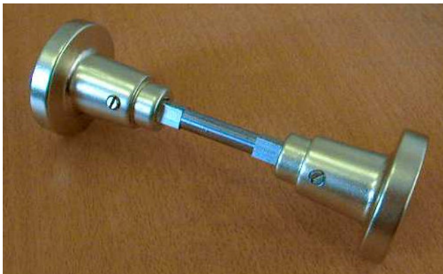
pár koulí CLASSICA 985 se čtyřhranem F13