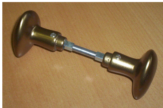
pár koulí DALLAS 910 se čtyřhranem F13