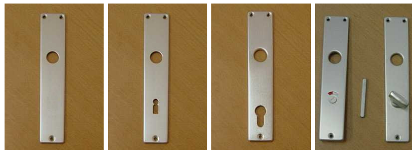
štítek 619 štítek 620 štítek 650 štítek 690