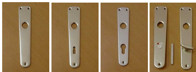
štítek 609 štítek 610 štítek 640 štítek 680

Pokud máte dveře širší než cca 5 cm, objednejte si delší čtyřhran a k němu místo páru klik dva kusy samostatné kliky s otvorem. Tyto kliky mají kód 110, 210, 310 a 410.