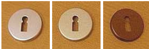
stříbrný elox šampaňský elox bronzový elox