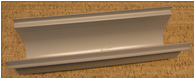
žlábek 1354 žlábek 1354

Vnější rozměry: šířka 14,8 cm, délka 250 cm, hloubka 14,2 cm. Vnitřní rozměry: šířka pro rošt 12,6 cm, šířka žlábků pod roštem 9,7 cm, hloubka pod roštem 11,5 cm. Žlábek je ve spodní části hladký a neobsahuje žádné hrdlo. Vývod můžete použít pouze na uzávěru. U tohoto žlábků nelze použít žádnou pojistku proti zvednutí roštu.